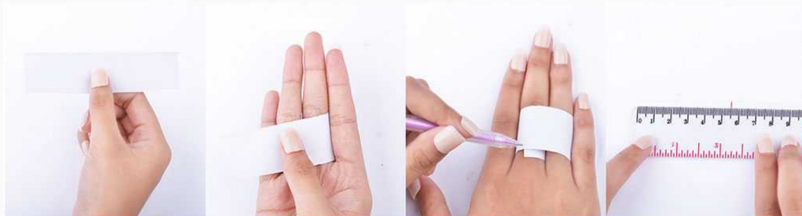
1. lingkarkan kertas di jari

Lingkarkan kertas di jari, jangan longgar, & tandai dengan pen. Lepaskan kertas tersebut dan ukurlah jarak antara dua garis di kertas dengan penggaris, dalam satuan milimeter.